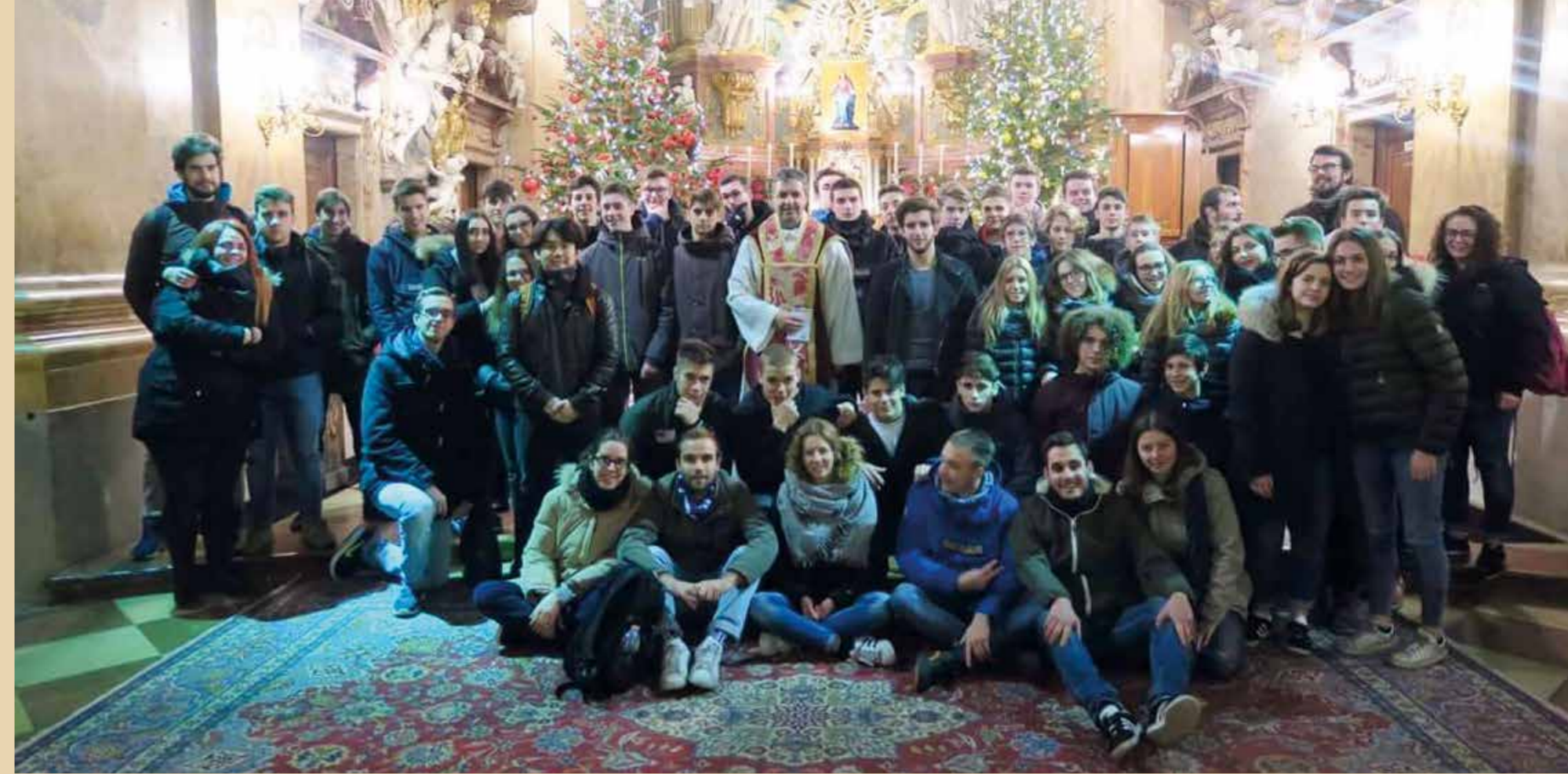
Gita del gruppo adolescenti a Vienna 26-30 dicembre 2016