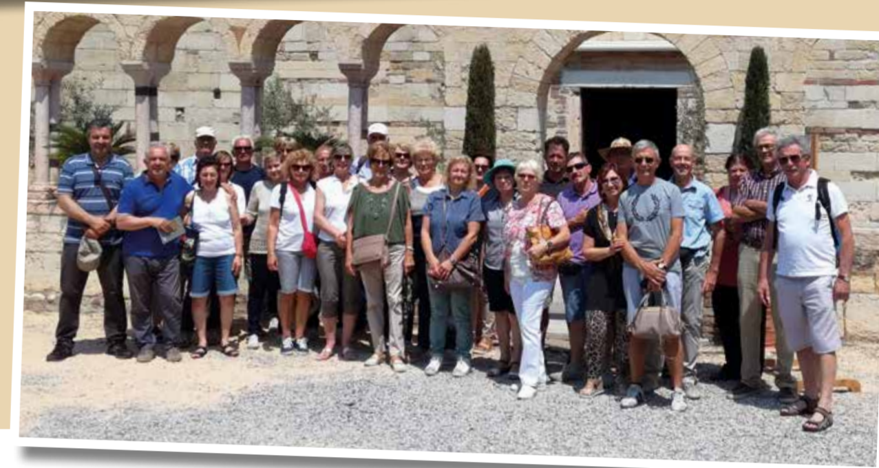
Pellegrinaggio a Verona Minor Hierusalem, 2 giugno 2017