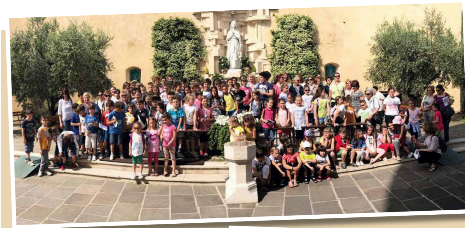
Gita di FINE CATECHISMO al Santuario di Lourdes, Verona