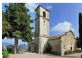
S. MARIA IN VALVERDE